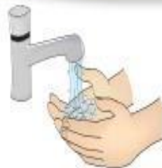
Higienização das mãos