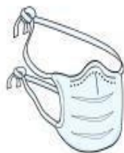
Máscara Cirúrgica (profissional)