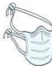
Máscara Cirúrgica (paciente durante o transporte)