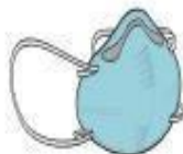
Máscara PFF2 (N-95) (profissional)