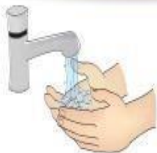
Higienização das mãos