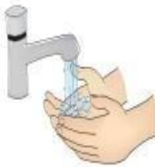
Higienização das mãos

Devem ser seguidas para TODOS OS PACIENTES , independente da suspeita ou não de infecções.