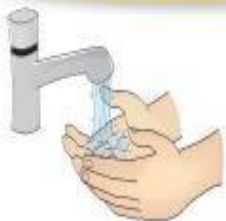
Higienização das mãos