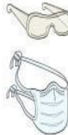
Óculos e Máscara