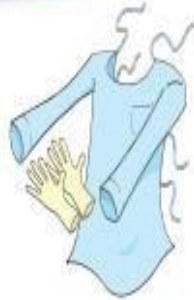
Luvas e Avental