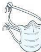
Máscara Cirúrgica (paciente durante o transporte)